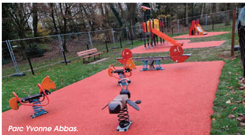
Parc Yvonne Abbas.

Parc Botanique : à proximité du Grand Boulevard