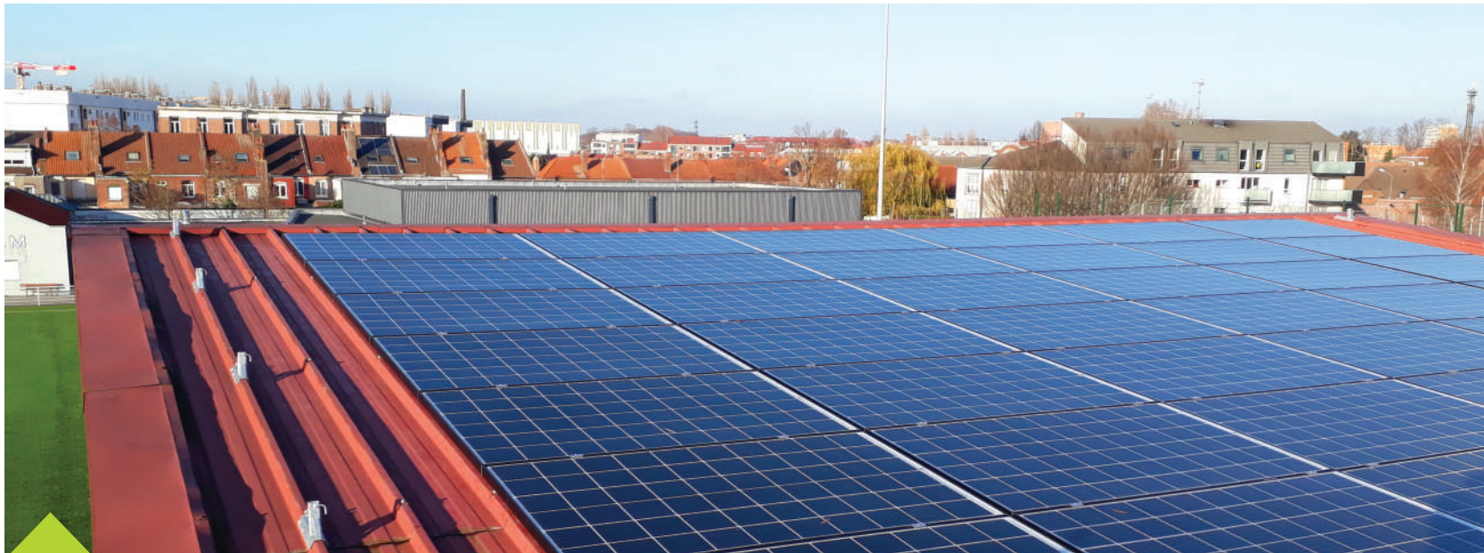
Depuis le 3 décembre dernier, le toit de la tribune du Stade Carpentier est équipé de panneaux photovoltaïques. Couvrant une surface de 100m 2

A la clé, une meilleure maîtrise de la consommation d'énergie et surtout des économies réalisées grâce à une production locale d'électricité. Nous vous détaillons tout sur le Plan SOLAMAD, l'un des quatre piliers du Carré Magique Écologique Madeleinois.